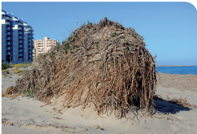
Figura 3. Ejemplar longevo casi totalmente desenterrado de Asparagus macrorrhizus , en las dunas del Pudrimel (febrero de 2020).

Mediterráneo, se produciría prácticamente la desaparición al completo del hábitat y de la población natural de Asparagus macrorrhizus , de modo que la especie podría quedar casi extinta en estado silvestre por el cambio climático. Sus posibles efectos han quedado evidenciados por el fuerte temporal de la Borrasca Gloria, en enero de 2020, cuando el oleaje alcanzó arenales que no habían sufrido una perturbación de origen natural tan intensa en décadas, siendo severamente dañados algunos ejemplares longevos y notables de esparraquera del Mar Menor (Fig. 3).