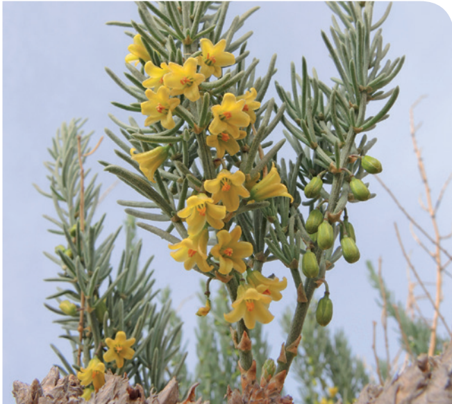
Figura 2. Tallos nuevos con flores y botones florales de Asparagus macrorrhizus (principios de abril de 2018).

taxón, la esparraguera del Mar Menor ( Asparagus macrorrhizus ) (Fig. 2 y 3), se convirtió así en la quinta especie endémica exclusiva de la Región de Murcia. Además, en 2015, fue evaluada para la Lista Roja de Especies Amenazadas de la UICN 2018 (Ríos, 2018), en el mismo sentido que en la lista roja de España, reconociéndose a nivel mundial la categoría «En peligro crítico» (CR), según criterio B1ab(i,ii,iii) y se estimó que contaba con 800 individuos.